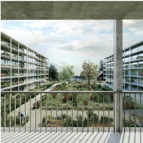
Perspektive mit zum Wasser sich öffnendem Garten

Das Vorhaben auf dem rund 10.000 m 2 großen Areal soll in zwei Bauabschnitten mit einer Gesamtmietfläche von rund 25.000 m 2 realisiert werden. Im ersten Bauabschnitt sind rund 250 Wohnungen und ergänzende Gewerbeflächen geplant. Die Hälfte der Mietwohnungen entsteht im geförderten Preissegment und trägt damit nachhaltig zu stabilen Quartieren und der Sicherung bezahlbaren Wohnraums in allen Lagen Berlins bei.